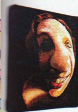
Qui, Cariati, cinque tele estroflesse della serie Onde di luce , 2010.

Maurizio Cariati. Il ritratto esce dalla tela